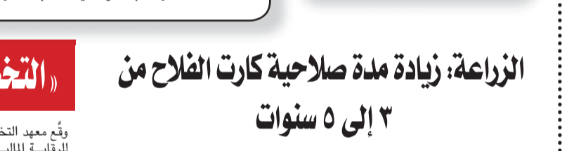
السيد القصير وزير الزراعة مع ممثلي البنك الزراعي وشركة إبي فاينانس.

بحث السيد القصير وزير الزراعة واستصلاح الأراضي: ما تم من جهود في مجال التحول الرقمي وكذلك آليات تطوير منظومة كارت الفلاح عن طريق زيادة مدة صلاحية الكارت من ٥ سنوات إلى ٥ سنوات. وشدد القصير خلال الاجتماع مع بعض قيادات الوزارة المعنيين بمنظومة كارت الفلاح بحضور ممثلي البنك الزراعي وشركة إبي فاينانس، على ضرورة أن يتم تقديم تقرير آراء أسبوعي لجهود تطوير المنظومة.