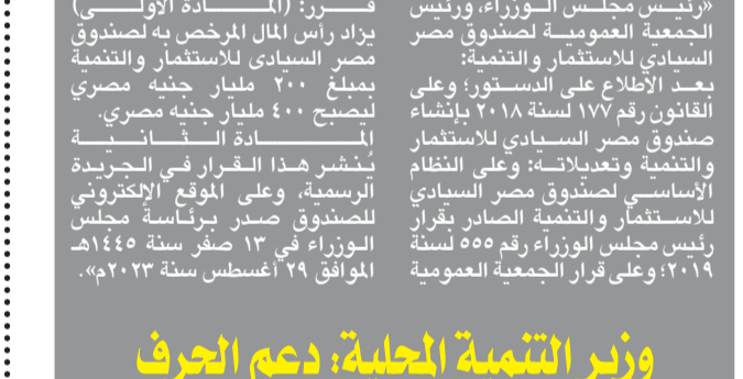
مجلس الوزراء يوافق على زيادة رأس مال صندوق مصر السيادي.

نشرت الجريدة الرسمية في العدد ٣٤ مكر (ك) قرار رئيس مجلس الوزراء بزيادة رأس مال صندوق مصر السيادي من ٢٠٠ مليار إلى ٤٠٠ مليار جنيه. وقد وافق مجلس الوزراء ورئيس الجمهورية على القرار في ٢٩ أغسطس ٢٠٢٣.