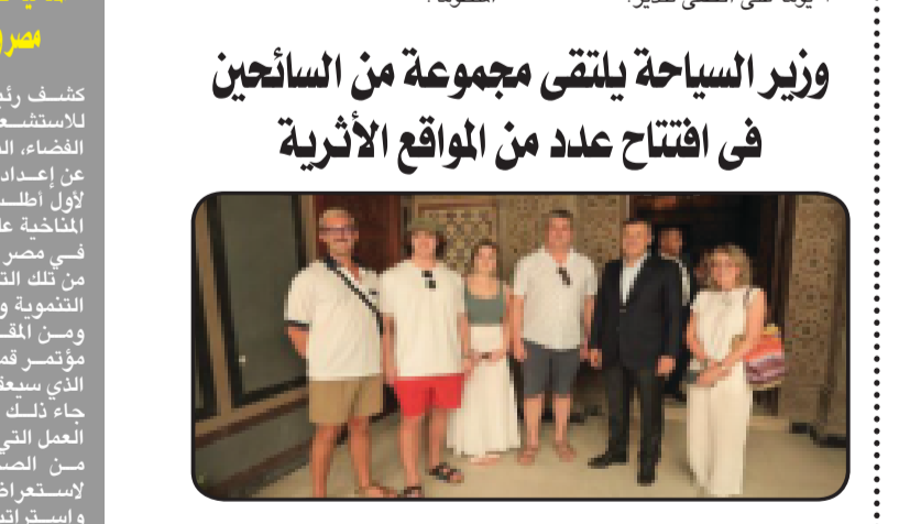
وزير السياحة أحمد عيسى مع مجموعة من السائحين في افتتاح المواقع الأثرية.

خلال مشاركة أحمد عيسى وزير السياحة والآثار، في افتتاح عدد من المواقع الأثرية بمنطقة مصر القديمة بعد الانتهاء، من استكمالهم بزيارة مصر والوقوف على السياحة والآثار بها والاسيما زيارتهم لمنطقة آثار العراصات الحيرة واستكمالهم لزيارة باقي معالم القاهرة الثقافية، والتي يمكن الاستفادة بها خلال الزيارة الواحدة. وقد رحب الوزير بهم معربا عن تمنياته لهم بزيارة ممتعة وتجربة سياحية مميزة في مصر، مؤكدا على أن مصر ترحب بكافة ضيوفها من مختلف دول العالم كما استعرض خلال حديثه تميز المقصد السياحي المصري والعديد من الأنشطة والتنتجات والقصوات السياحية والآثار التي يمكن الاستفادة بها خلال الزيارة الواحدة. كما أعرب عن تمنياته بأن يقوما بقتل