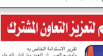
مجلس الوزراء يوافق على زيادة رأس مال صندوق مصر السيادي.

نشرت الجريدة الرسمية في العدد ٣٤ مكر (ك) قرار رئيس مجلس الوزراء بزيادة رأس مال صندوق مصر السيادي من ٢٠٠ مليار إلى ٤٠٠ مليار جنيه. وقد وافق مجلس الوزراء ورئيس الجمهورية على القرار في ٢٩ أغسطس ٢٠٢٣.