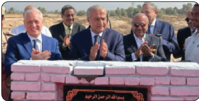
وزير التموين : الدولة تحتاج إلى إقامة 7 مستودعات استراتيجية في عدد من المحافظات و تم التعاقد مع عدة شركات خاصة من أجل إتمام عملية البناء والتصميم